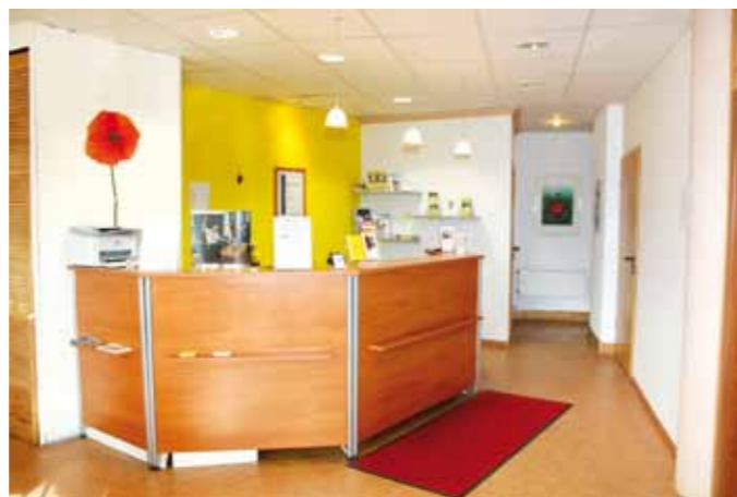
Hörgeräte B. Kress