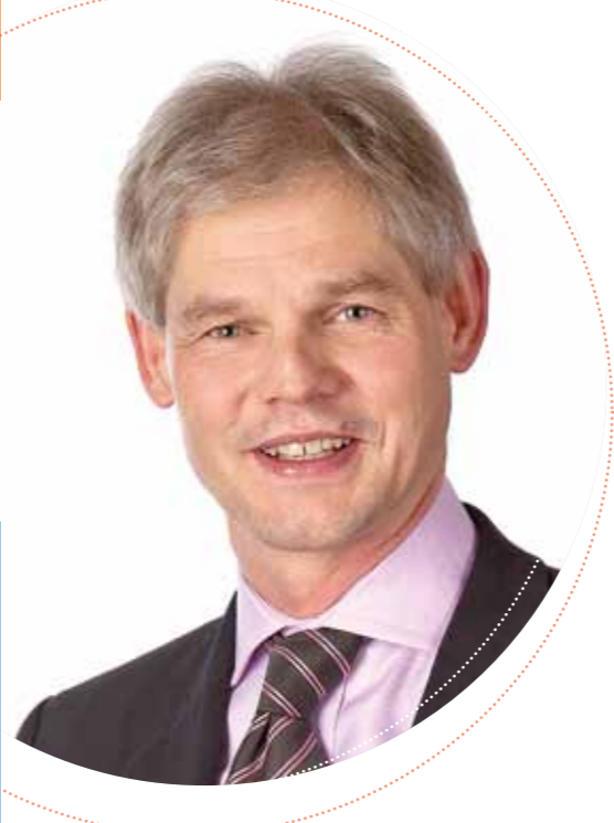
Grußwort Stadt Salzgitter