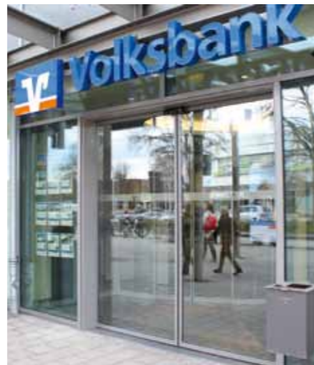
Volksbank eG Braunschweig Wolfsburg