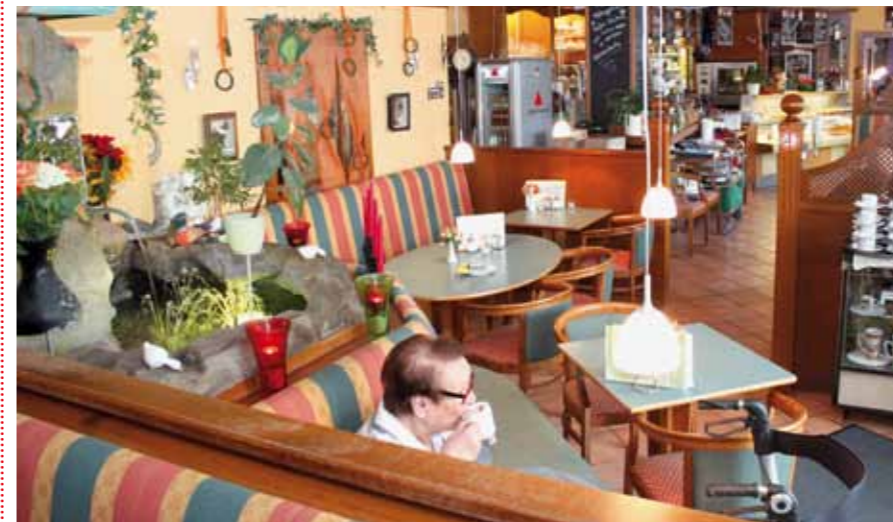
Café am Brunnen