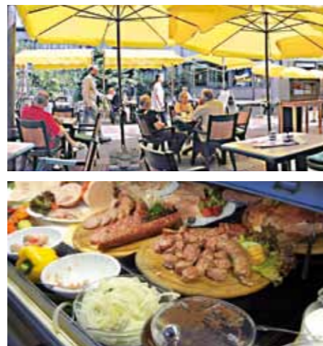
City Café – Restaurant, Café und Bistro