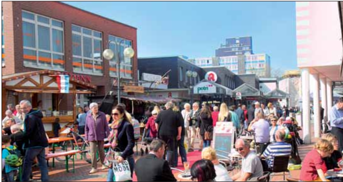
Tausende Besucher strömen in die Innenstadt.

Der Duft von Rostbratwürsten und andere regionalen Spezialitäten liegt beim Thüringer Markt in der Luft. An allen drei Bauernmarkt-Tagen können die Besucher vor dem Citytor-Center landestypische Spezialitäten genießen und traditionelles Handwerk entdecken. In der Mall findet der bei Besuchern überaus beliebte Herbstmarkt statt. Er hat an allen drei Tagen geöffnet: 20 Hobbykünstler präsentieren am Freitag (12 bis 18 Uhr), Samstag (10 bis 18 Uhr) und Sonntag (11 bis 18 Uhr) ihre Werke.