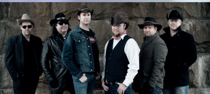
Dark Ride Brothers