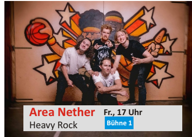
Area Nether Fr., 17 Uhr Heavy Rock Bühne 1