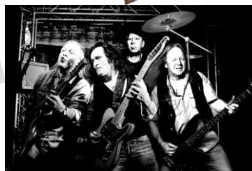
Rick n Rossi Sa., 21:30 Uhr Status Quo Tribute Bühne 1