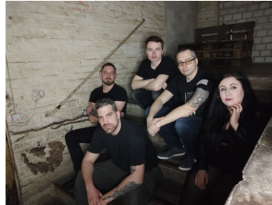
RaXem So., 16 Uhr Metalkombo aus BS Bühne 1 Sieger SALZIG-Contest 2022