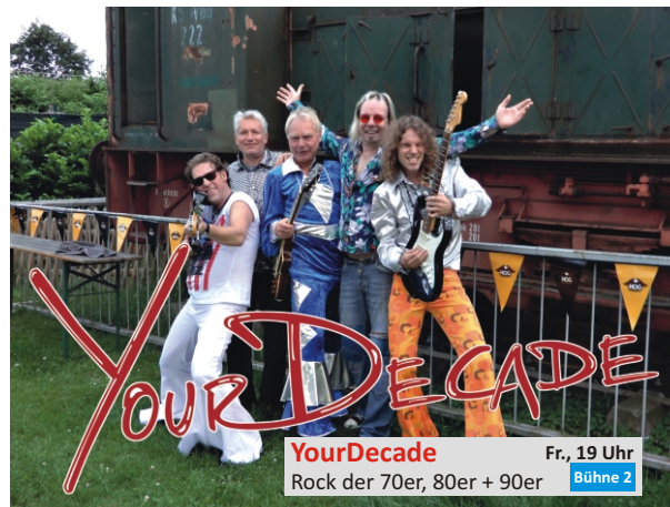
YourDecade Fr., 19 Uhr Rock der 70er, 80er + 90er Bühne 2

Kunst Kultur Musik www.bock-auf-rock-sz.de