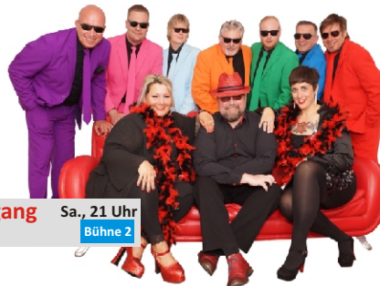
Sharp & The Soulgang Sa., 21 Uhr Best of Disco Bühne 2