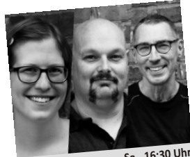
Never get Famous Sa., 16:30 Uhr Rock-Pop-Country-Folk Bühne 2