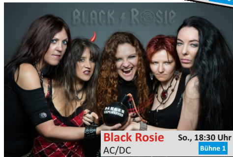
Black Rosie So., 18:30 Uhr AC/DC Bühne 1