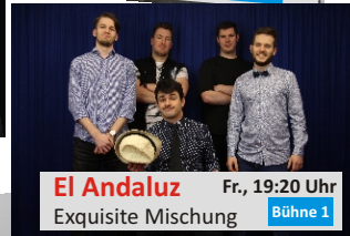
El Andaluz Fr., 19:20 Uhr Exquisite Mischung Bühne 1