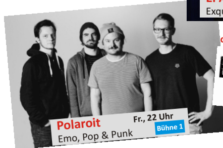
Polaroid Fr., 22 Uhr Emo, Pop & Punk Bühne 1