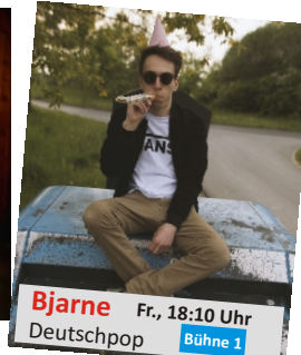
Bjarne Fr., 18:10 Uhr Deutschpop Bühne 1