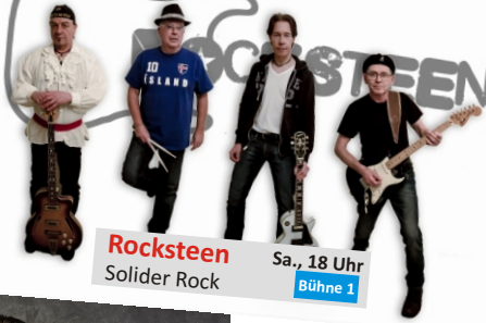
Rocksteen Sa., 18 Uhr Solider Rock Bühne 1